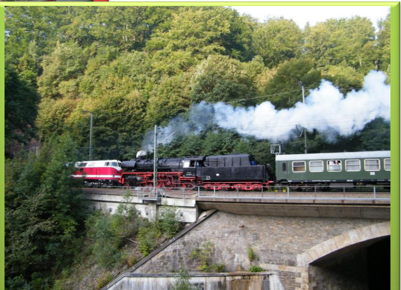
Bessere Idee! – Wandern nach – oder Pause in Edle Krone!